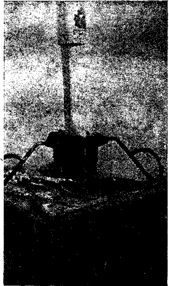
KDYA test kuyusunda fişkırmaya geldikten sonra sondaj borusu